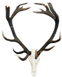
CIC 218.78 2018 r.